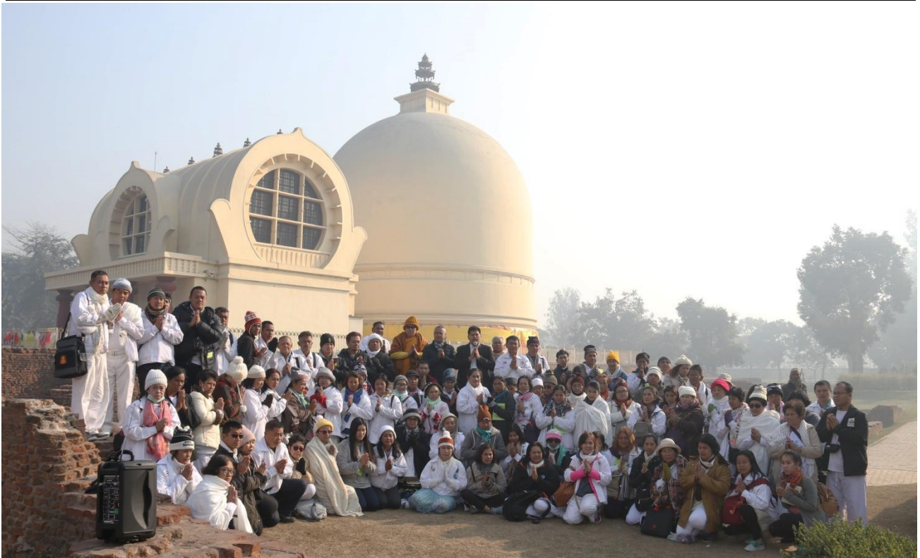
กุสินารา : ศาลาโนทยาน ปรินิพพานสถูป สถานที่เสด็จดับขันธปรินิพพาน วันอังคาร ขึ้น 15 ค่ำ เดือน 6 ปีมะเส็ง ไฮไลต์หัวใจสำคัญ : ปรินิพพานสถูป พระเจ้าอโศกมหาราช สร้างครอบตรงจุดที่ พระพุทธเจ้าปรินิพพาน พ.ศ.241