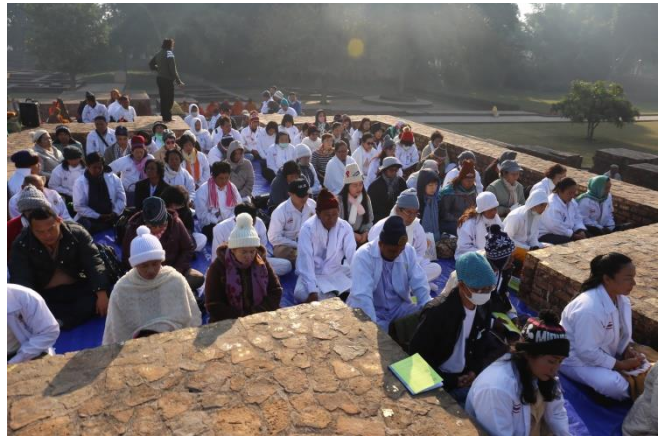
กิจกรรมโครงการฯ : สวดมนต์ เจริญสมาธิภาวนา ณ ดันธกุฎี เจดีย์พระอรหันต์ 8 ทิศ : ชมบ้านอนาถบิณฑิกเศรษฐี