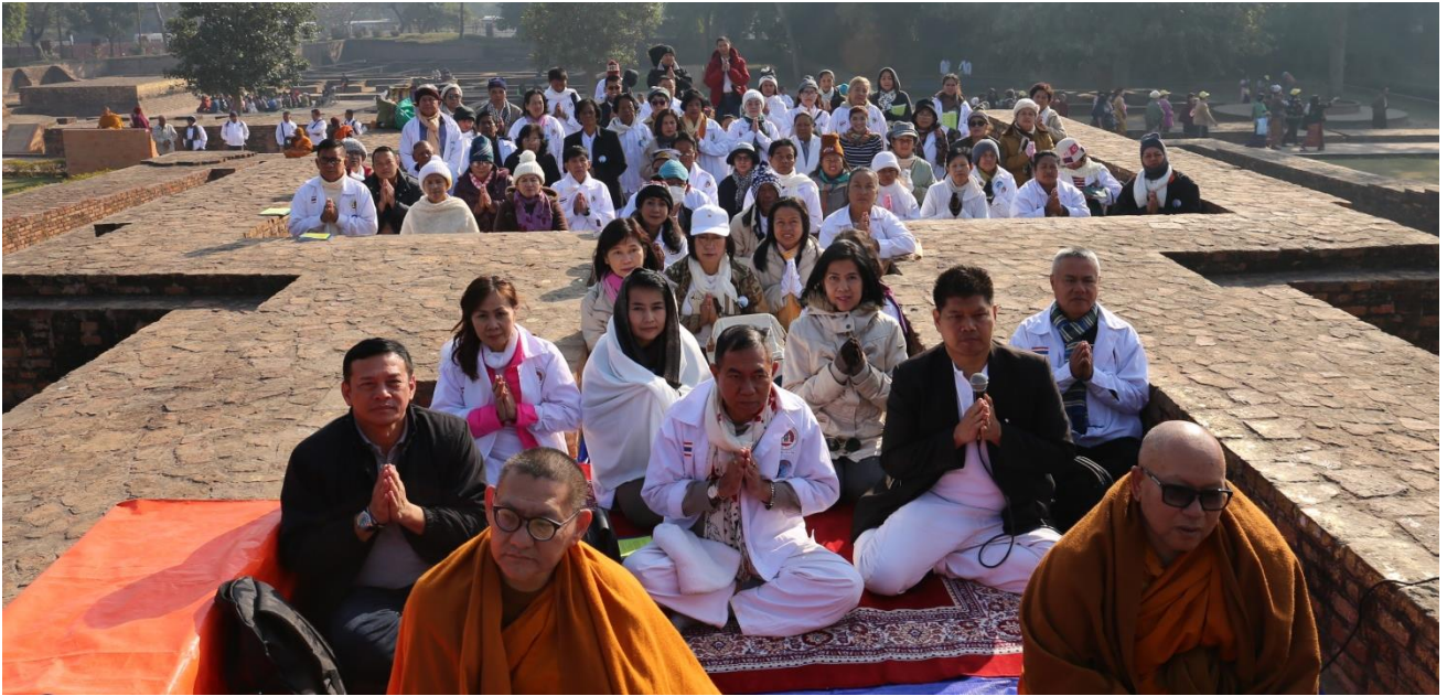
วัดเชตวันมหาวิหาร สถานที่ประทับอยู่นาน 19 พรรษา : สาวัตถี 25 พรรษา (เชตวัน 19+บุปผาราม 9 = 25 พรรษา)

วันที่ : พาราณสี-สาวัตถี วัดเชตวัน-บ้านอนาถบิณฑิกะ-บ้านอภิลักขิต-กบิลพัสดุ์-ลุมพินี พฤษภาคม 8 ก.พ. 61