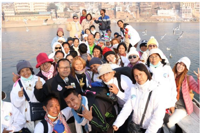
แม่น้ำคงคา : ตามคัมภีร์ปุราณะของฮินดูเชื่อว่า เป็นสายน้ำที่ศักดิ์สิทธิ์ ไหลมาจากมวยผมของพระศิวมหาเทพ บนสรวงสวรรค์ ไหลลงสู่โลกมนุษย์ จากภูเขาหิมาลัย ผ่านถ้ำยี่เกศ มาถึงพาราณสี - ปัดนะ ไหลลงสู่อ่าวเบงกอล