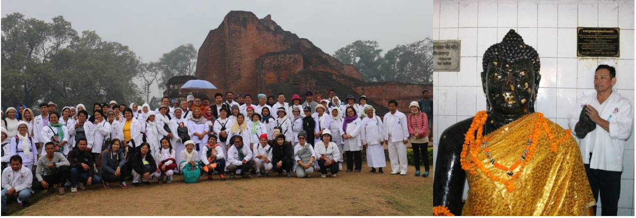
มหาวิทยาลัยนาลันทา มหาวิทยาลัยแห่งแรกของโลก : หลวงพ่อดำ สร้างในสมัยพระเจ้าทเวาปาละ อายุ 1,300 ปีเศษ

วันที่เก้า : พุทธศกยา – ต้นพระศรีมหาโพธิ์ - สุวรรณภูมิ