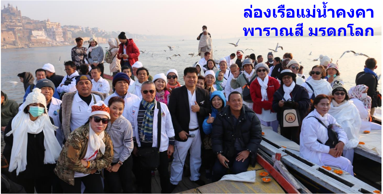
พาราณสี : ล่องเรือแม่น้ำคงคา ชมมณิกรรณิกามาต ท่าที่เผาไฟไม่เคยดับ 4,000 กว่าปี พิธีอาบน้ำชำระล้างบาป