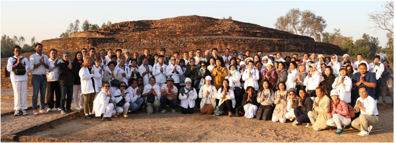
กบิลพัสดุ์ : สถูปเจดีย์ที่ค้นพบพระบรมสารีริกธาตุแห่งนี้ ไทยได้รับส่วนแบ่งมาบรรจุไว้ที่เจดีย์ภูเขาทอง กทม.