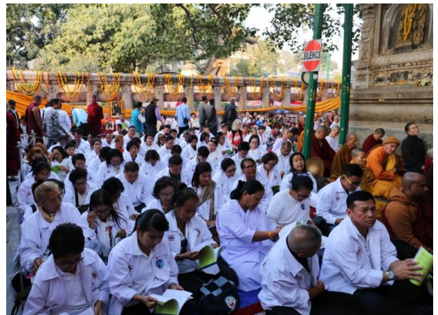
ต้นพระศรีมหาโพธิ์ สถานที่ตรัสรู้ : ปฐุวินาถิ สะดือของโลภ จุคศูนย์กลางของโลภ พิธีสวดมนต์ เจริญสมาธิภาวนา