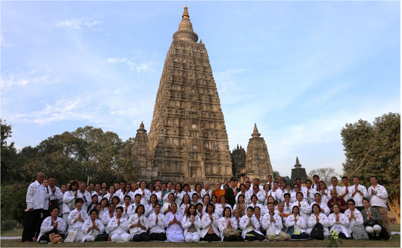
เจดีย์พุทธคยา : อนุสรณ์แห่งการตรัสรู้ สร้างโดย พระเจ้าอโศกมหาราช พ.ศ.254, พระเจ้าหุวิษกะ ต่อเติม พ.ศ.674