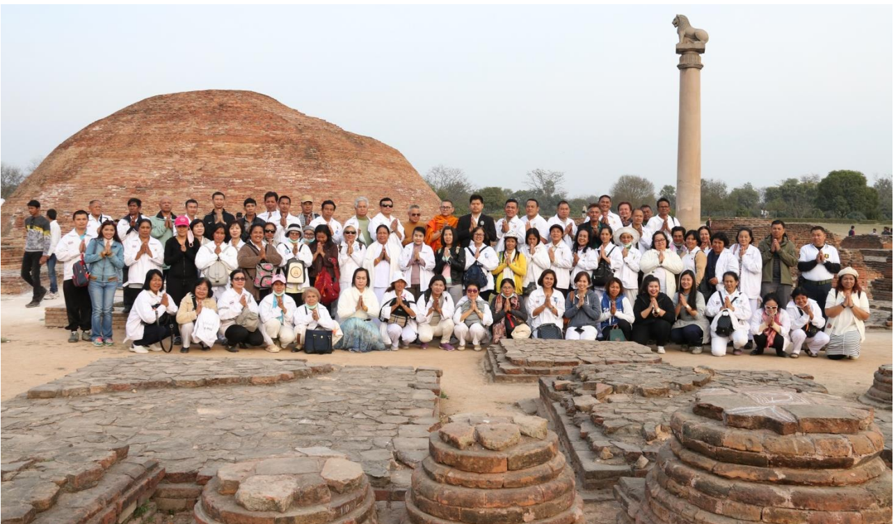
วัดป่ามหาวัน : สถานที่เกิดขึ้นแห่งภิกษุณีสงฆ์ครั้งแรกของโลก (สถานที่ทรงจำพรรษาที่ 5) เมืองเวสาตี แคว้นวัชชี