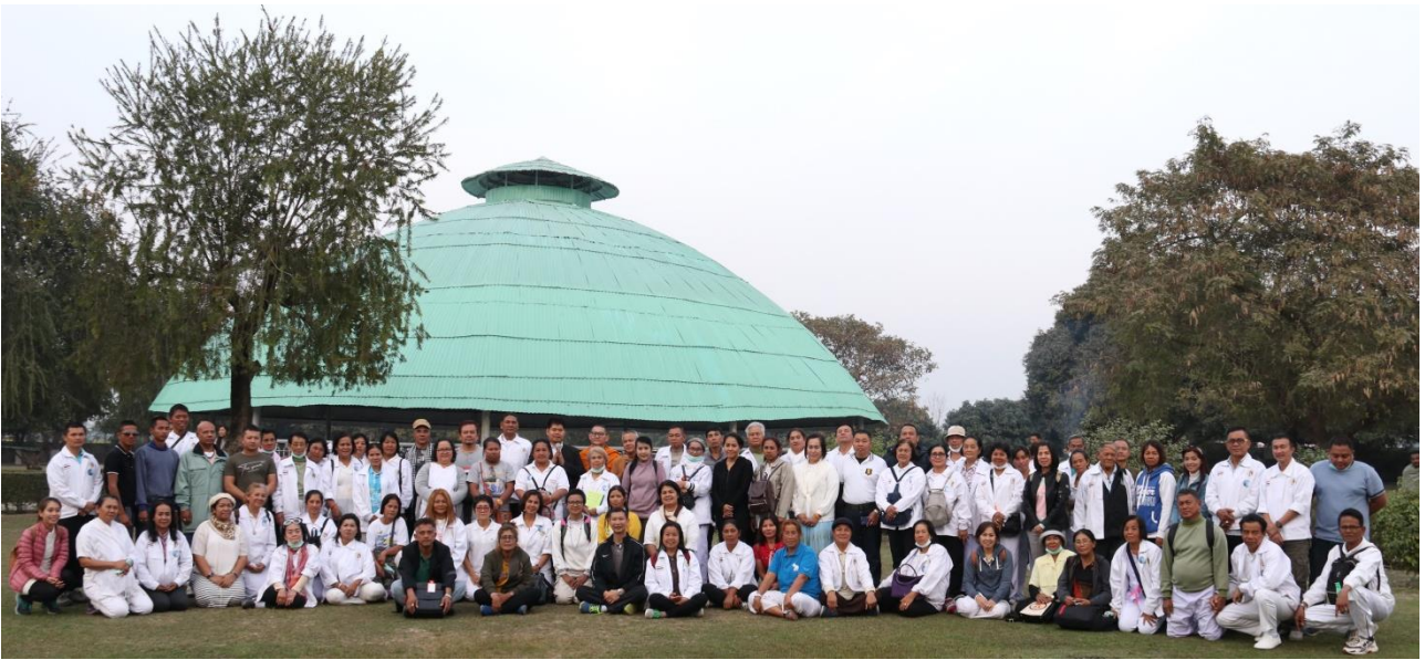
ปาวาลเจดีย์ : สถานที่ทรงปลงอายุสังขาร ในวันเพ็ญขึ้น 15 ค่ำ เดือน 3 (อัมพวคาม ที่ทรงจำพรรษาสุดท้ายที่ 45)