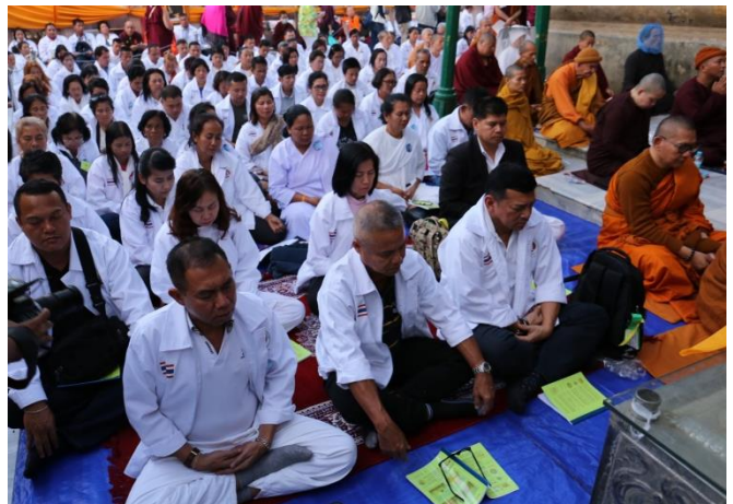
กิจกรรมโครงการฯ : นำคณะสวดมนต์ เจริญสมาธิภาวนา ณ ต้นพระศรีมหาโพธิ์ สถานที่ตรัสรู้ของพระพุทธเจ้า