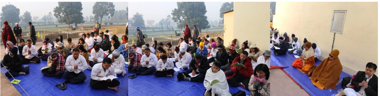
ปรินิพพานสถูป : สถานที่ปรินิพพานของพระพุทธเจ้า ในวันอังคาร ขึ้น 15 ค่ำ เดือน 6 ปีมะเส็ง