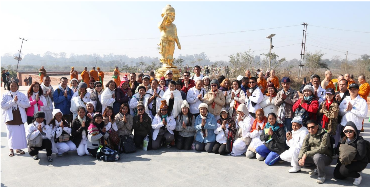
กิจกรรมโครงการฯ : สวดมนต์ทำวัตร เจริญสมาธิภาวนา ณ เสาหินพระเจ้าอโศก-มยาเทวีวิหาร สถานที่ประดิษฐาน