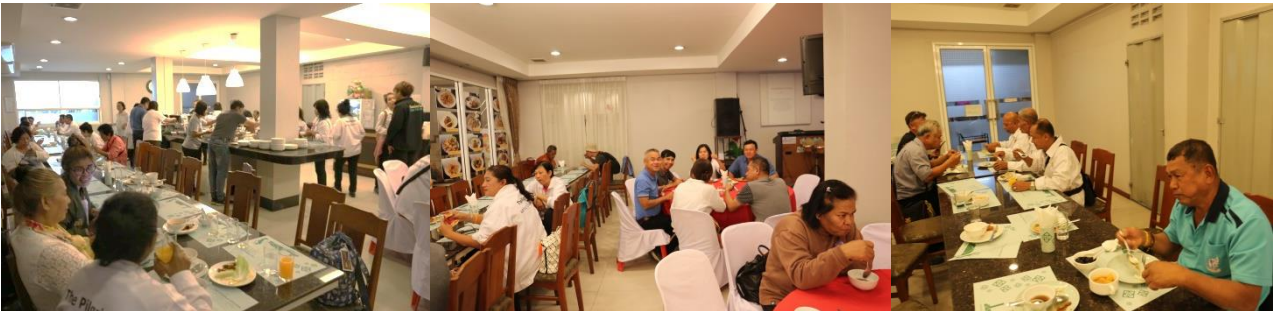
18.00 น. –บริการอาหารเย็น ณ ห้องอาหารของโรงแรม + และพักที่ โรงแรม โกลเด้น เจด สุวรรณภูมิ

วันที่สิบ : สุวรรณภูมิ – ดอนเมือง – หาดใหญ่ - กลับภูมิลำเนา