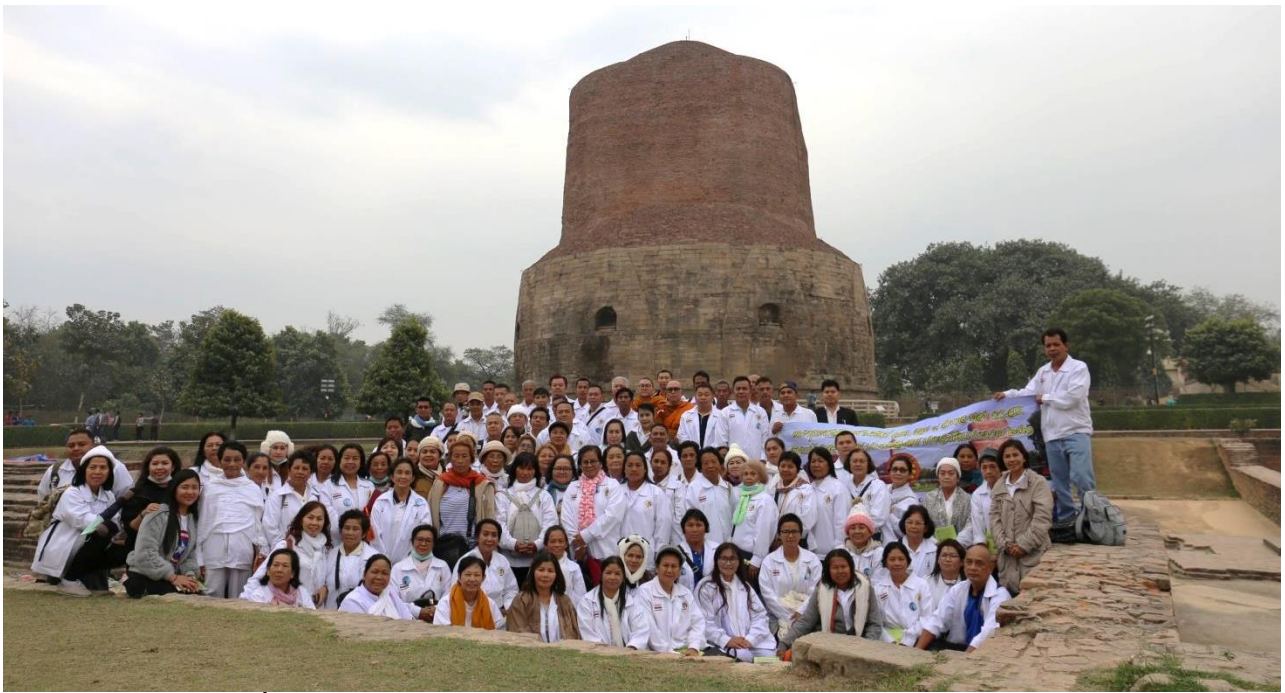
ชมเมกขสถูป : สถานที่แสดงปฐมเทศนา ชมจักกัปปวัตตนสูตร ณ ป่าอิติปตนมฤคทายวัน : สารนาถ พาราณสี