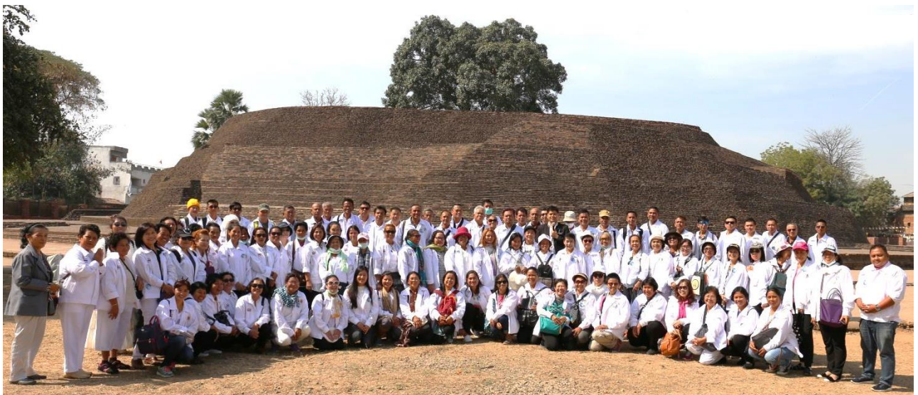
สถูปบ้านนางสุชาดา ผู้ถวายข้าวมธุปายาส แต่พระมหามงกุฎโพธิสัตว์ ก่อนตรัสรู้เป็นพระอนุตรสัมมาสัมโพธิญาณ