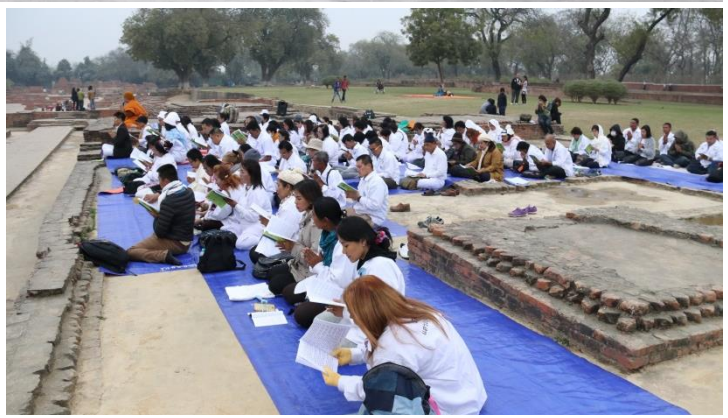
อิธิปตนมฤคทายวัน : พระมูลคันธกุฎี - ยสเจดีย์ ที่แสดงอนุปพุพิกถา – ัมมราชาสถูป ที่แสดงอนัตตลักขณสูตร