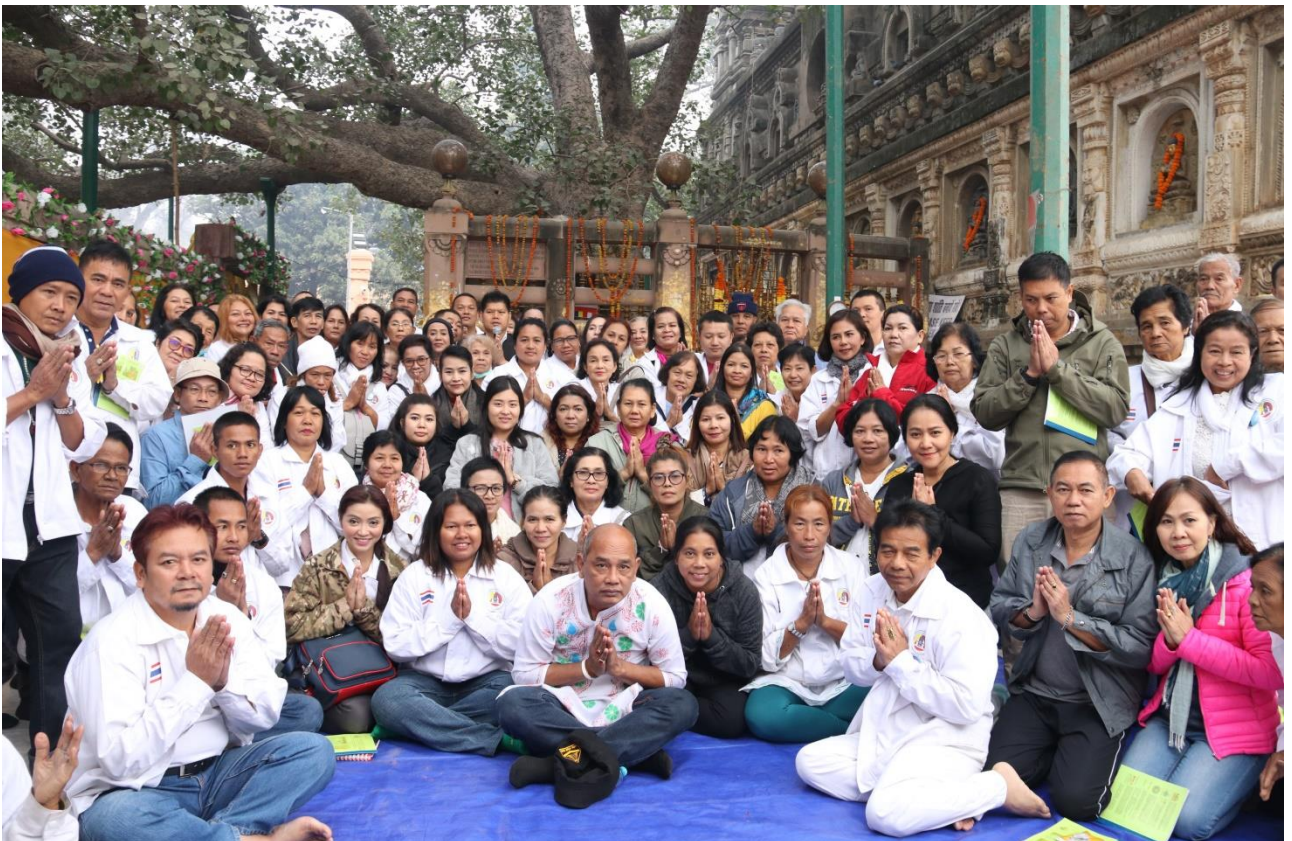
วันสุดท้ายแดนพุทธภูมิ : สวตมมนต์ เจริญสมาธิภาวนา ณ ต้นพระศรีมหาโพธิ์ : นมัสการลา/ขอพร พระพุทธเมตตา 12.30 น. – ออกเดินทางกลับไทย โดยสายการบิน BHUTAN AIRLINES (B3) เที่ยวบินที่ B3 706 (มีบริการอาหาร)