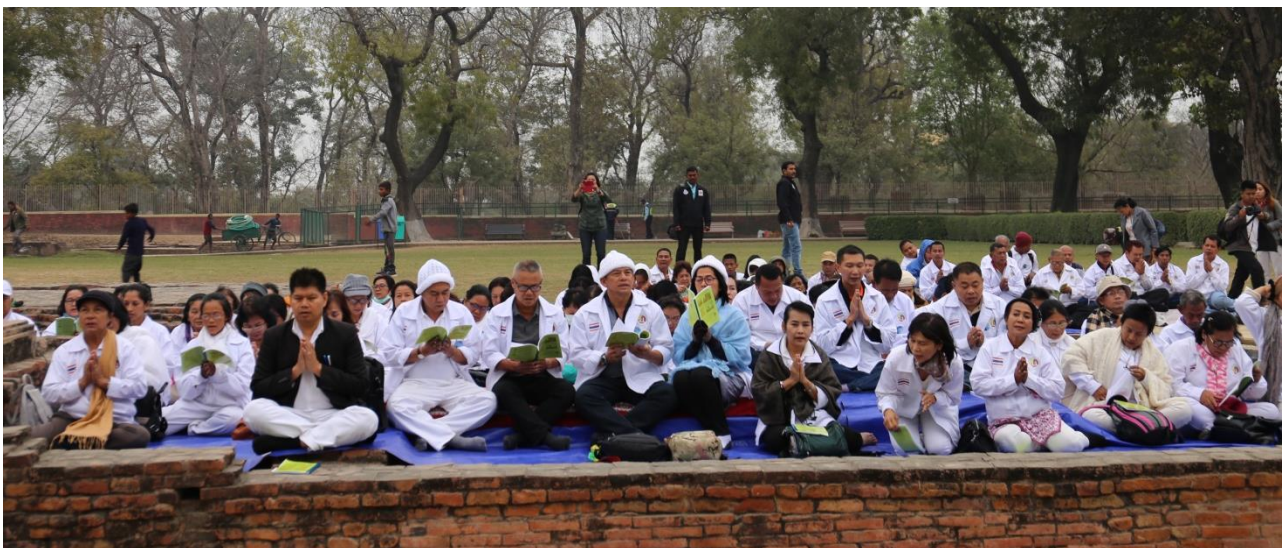
กิจกรรมโครงการฯ : สวดมมต์ทำวัตรเช้า เจริญสมาธิภาวนา สาธยายพระจักกัปปวัตตนสูตร ณ ชมเมกขสถูป