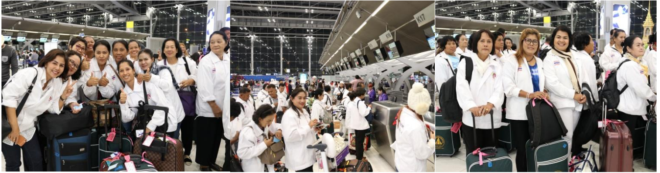
เดินทางจากสุวรรณภูมิ สู่พุทธคยา ประเทศอินเดีย โดยสายการบิน BHUTAN AIRLINES (แบบเช่าเหมาลำพิเศษ)

07.30 น. -ออกเดินทางสู่พุทธคยา โดยสายการบิน BHUTAN AIRLINES เที่ยวบินที่ B3 707 (มีบริการอาหารบนเครื่อง) 10.00 น. - (เวลาท้องถิ่น/อินเดีย ซ้ำกว่าไทย 1 ชั่วโมงครึ่ง) ถึงสนามบินนานาชาติคยา (พุทธคยา/ที่ตรัสรู้) ประเทศอินเดีย