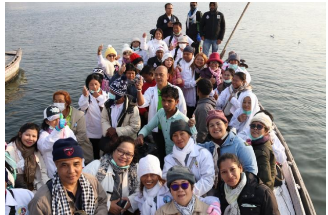
พิธีลอยกระทง เพื่อบูชาพระบรมสารีริกธาตุ และขอขมาแม่พระคงคา ณ แม่น้ำคงคา อันศักดิ์สิทธิ์ของชาวฮินดู