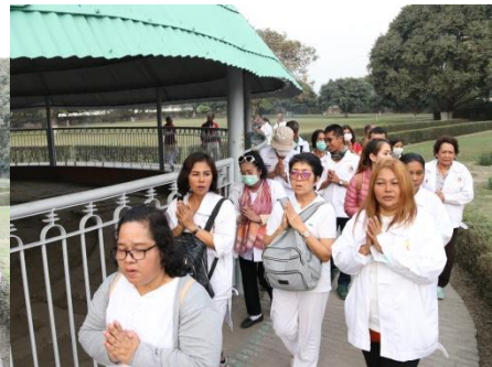
กิจกรรมโครงการฯ : สวดมนต์ เวียนทักษิณาวัตร เจริญสมาธิภาวนา ณ ปาวาลเจดีย์ เมืองเวสาตี แคว้นวัชชี