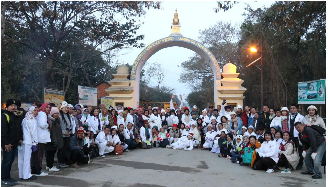
ลุมพินี : สถานที่ประดิษฐานของพระมหาโพธิสัตว์สิทธัตถะพระราชกุมาร วันศุกร์ ขึ้น 15 ค่ำ เดือน 6 ปีกจอก ก่อน พ.ศ.80 ปี