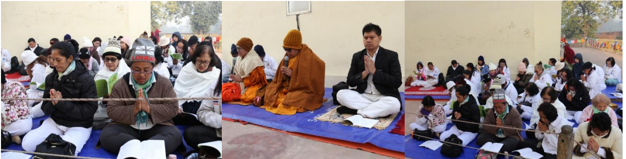
กิจกรรมโครงการฯ : พิธีสวดมนต์ เจริญสมาธิภาวนา ถวายผ้าห่มองค์พระพุทธปรินิพพาน ณ สถานที่ปรินิพพาน