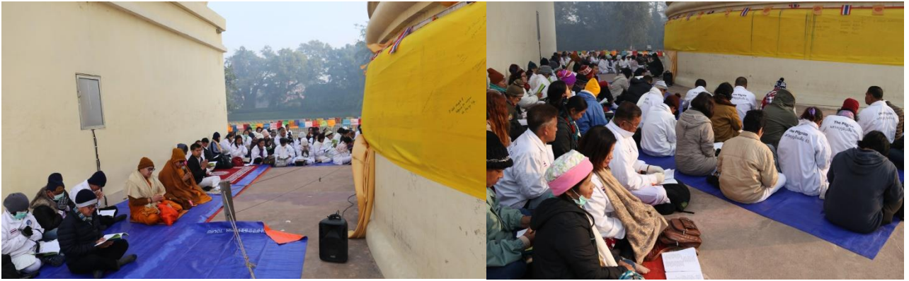
กุสินารา : ศาลาโนทยาน สถานที่ปรินิพพาน ปรินิพพานสถูป-ปรินิพพานวิหาร - พระพุทธรูปปางปรินิพพาน