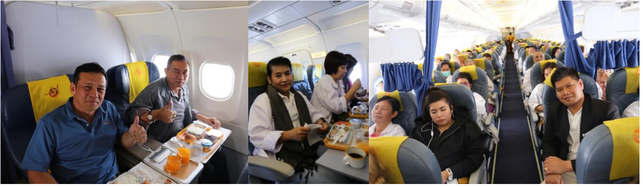
17.00 น. – ถึงสุวรรณภูมิ โดยสวัสดิภาพ + ต่อร์รถโค้ชปรับอากาศ เดินทางสู่ที่พักโรงแรมโกลเด้น เจด สุวรรณภูมิ