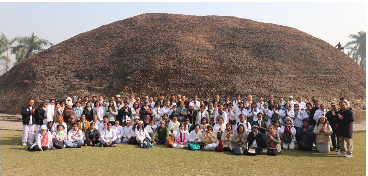
มกุฏพันธเจดีย์ : สถานที่ถวายพระเพลิงพระพุทธสรีระ ในวันอัฐมีบูชา แรม 8 ค่ำ เดือน 6