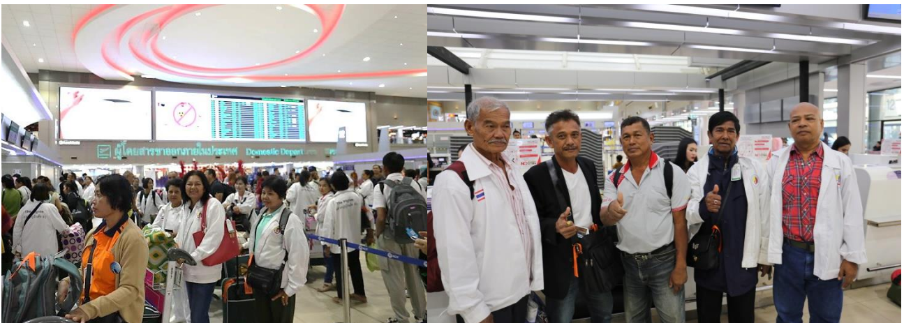
09.50 น. – ออกเดินทางสู่หาดใหญ่ โดยสายการบินไทยไลอ้อนแอร์ เที่ยวบินที่ SL 706