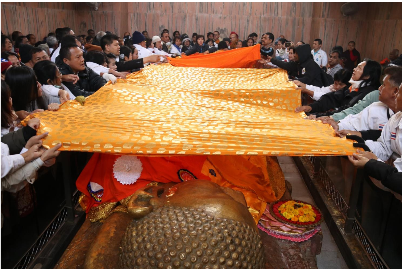
ปรินิพพานวิหาร : สร้างโดยคณะธรรมยาตราชาวพม่า พ.ศ.2470 ภายในประดิษฐาน พระพุทธปรินิพพาน สร้างโดย ช่างชื่อ ถินา ชาวมอญ พ.ศ.950 ทำจากหินทรายแดงก้อนเดียว ยาว 23 ฟุต กว้าง 5 ฟุต 6 นิ้ว องค์พระสูง 2 ฟุต 1 นิ้ว