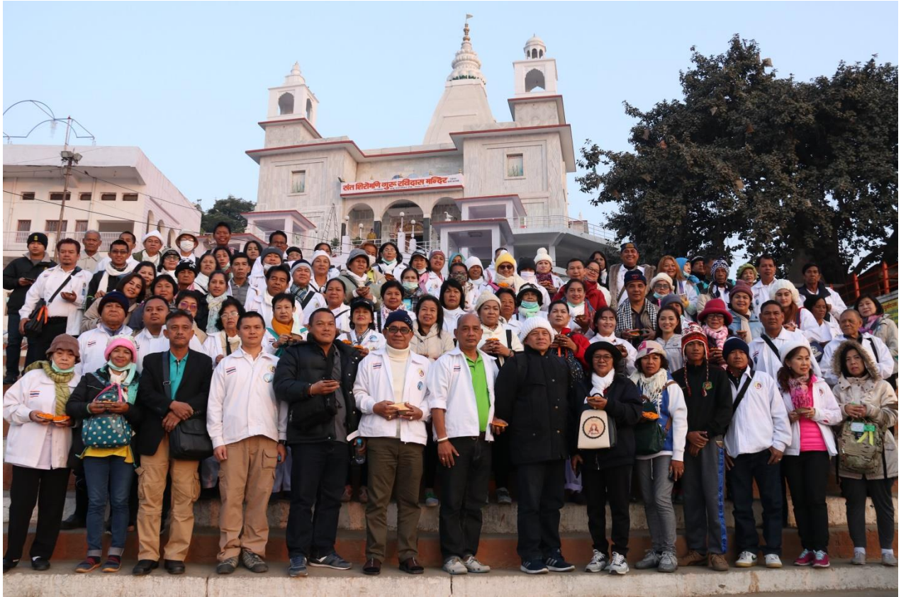
ทำราชมัต : จุดล่องเรือแม่น้ำคง 1 ใน 84 ท่า ของเมืองพาราณสี ตั้งอยู่ริมฝั่งแม่น้ำคงคา มีความยาว 2,550 ก.ม.