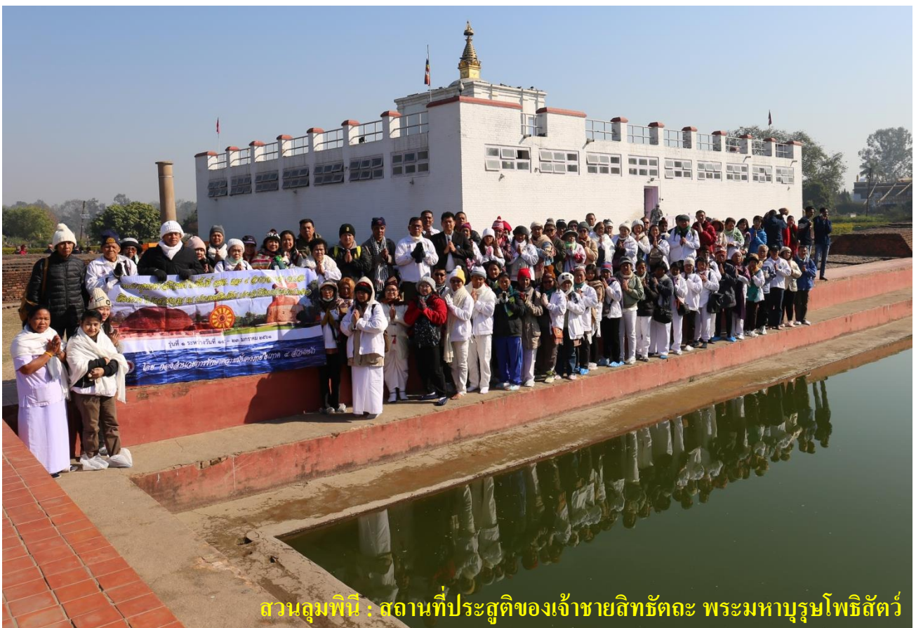
สวนลุมพินี : สถานที่ประสูติของเจ้าชายสิทธัตถะ พระมหากษัตริย์โพธิสัตว์