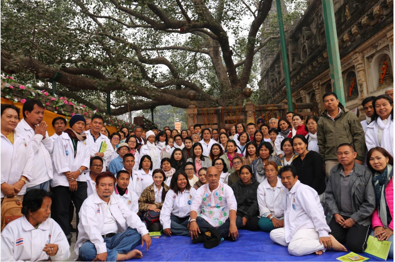
กิจกรรมโครงการฯ : นำคณะปฏิบัติธรรม เวียนทักษิณาวัตร ถวายผ้าห่มเป็นพุทธบูชา ณ ดันพระศรีมหาโพธิ์